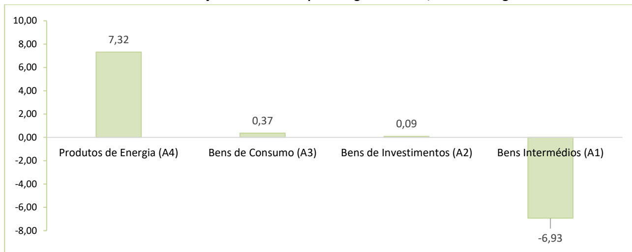
Gráfico 2 – Variação Mensal do IPP por Categoria de Bens, em Percentagem

No gráfico a seguir pode-se observar a evolução dos Índices de Preços no Produtor por tipo de bens.